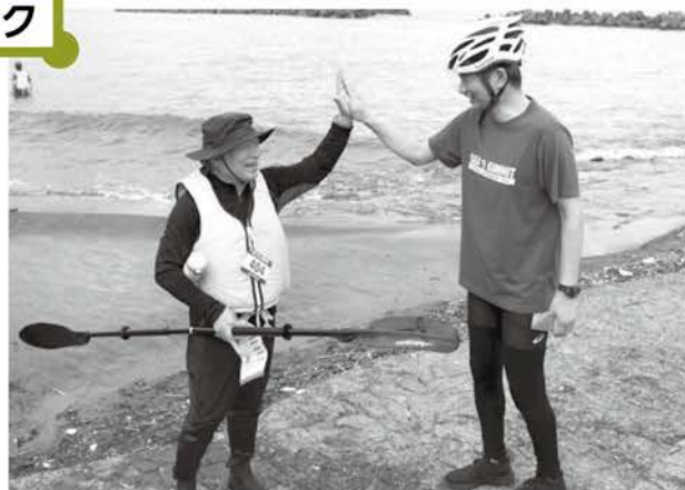
筒石港南公園で米田市長から中川市長（写真右）へバトンタッチ！