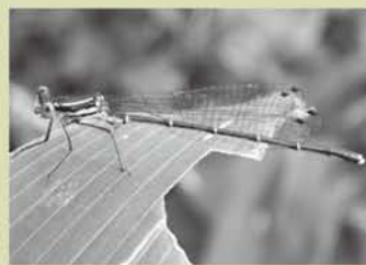
アマゴイルリトンボ