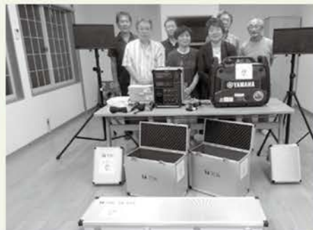
能生小泊地区の皆さん