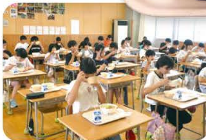
田沢小学校5年生の給食の様子