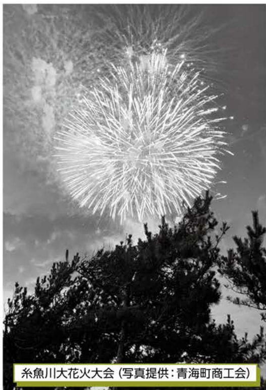
糸魚川大花火大会