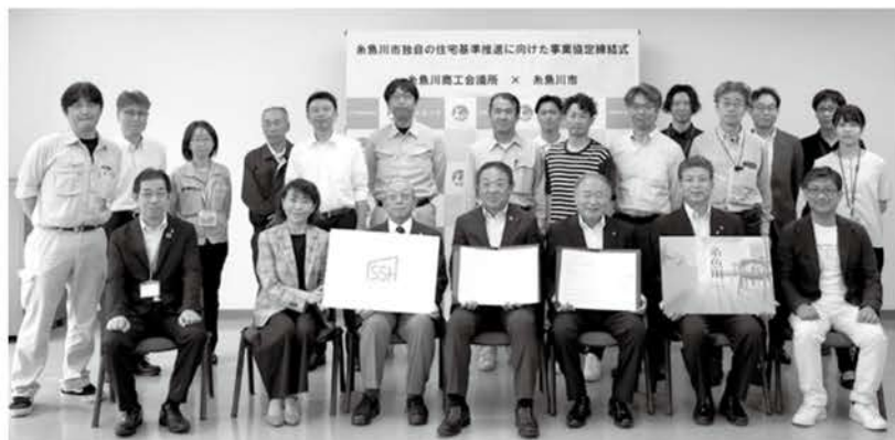
地元企業の皆さんや関係団体が集まり、締結式が行われました

今後も官民連携し、地元産業の発展と、脱炭素社会実現に向けた環境に優しく快適な省エネ住宅普及を目指します。