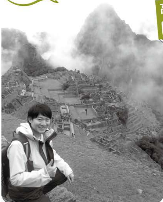
古代インカ帝国の遺跡・マチュピチュを散策中