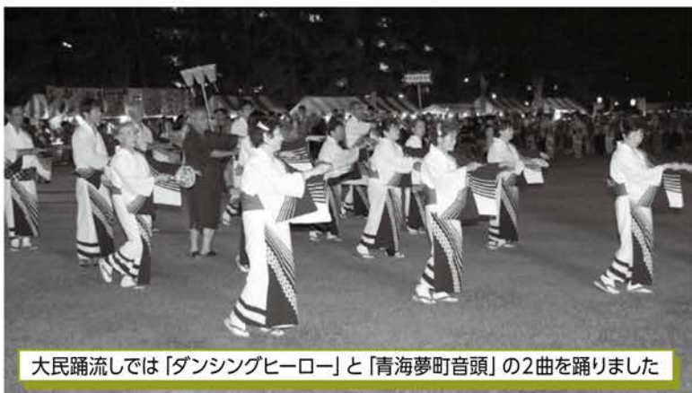
大民踊流しでは「ダンシングヒーロー」と「青海夢町音頭」の2曲を踊りました

コロナ禍の影響により中止となっていた大民踊流しが4年ぶりに行われ、子どもから大人まで幅広い世代が祭りを楽しみました。