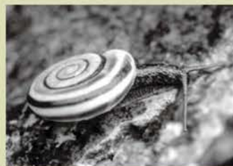
ムラヤママイマイ