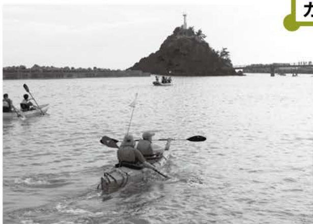
能生海水浴場からスタートし、カヤックで約6km先の筒石港南公園を目指します。