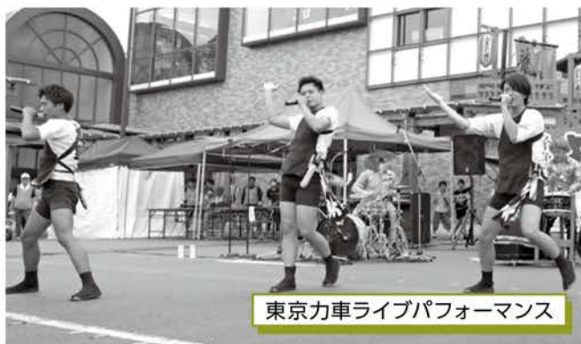
東京力車ライブパフォーマンス