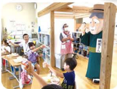
牛乳で乾杯してお祝い