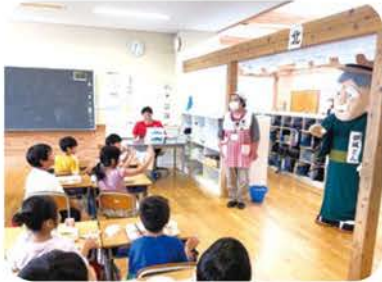
御風さんがサプライズで登場！

総合的な学習で御風さんについて学んでいる糸魚川小学校3年生のクラスには、ゆるキャラ「御風さん」が登場！7月生まれの御風さんへ、子どもたちからハッピーバースデーソングがプレゼントされ、お誕生日をお祝いしました。